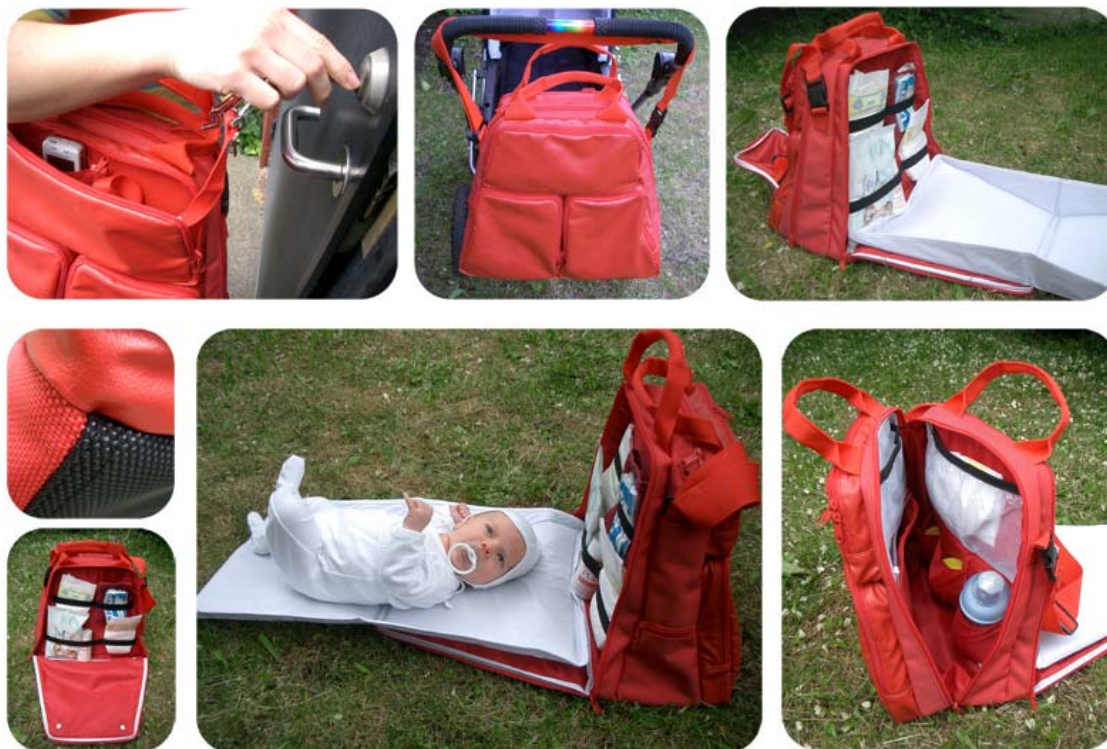
Examensarbete, Magisterexamen från Danmarks Design Skole, Skötväska, Prototyp tillverkning genom Libro Group AB, Göteborg.